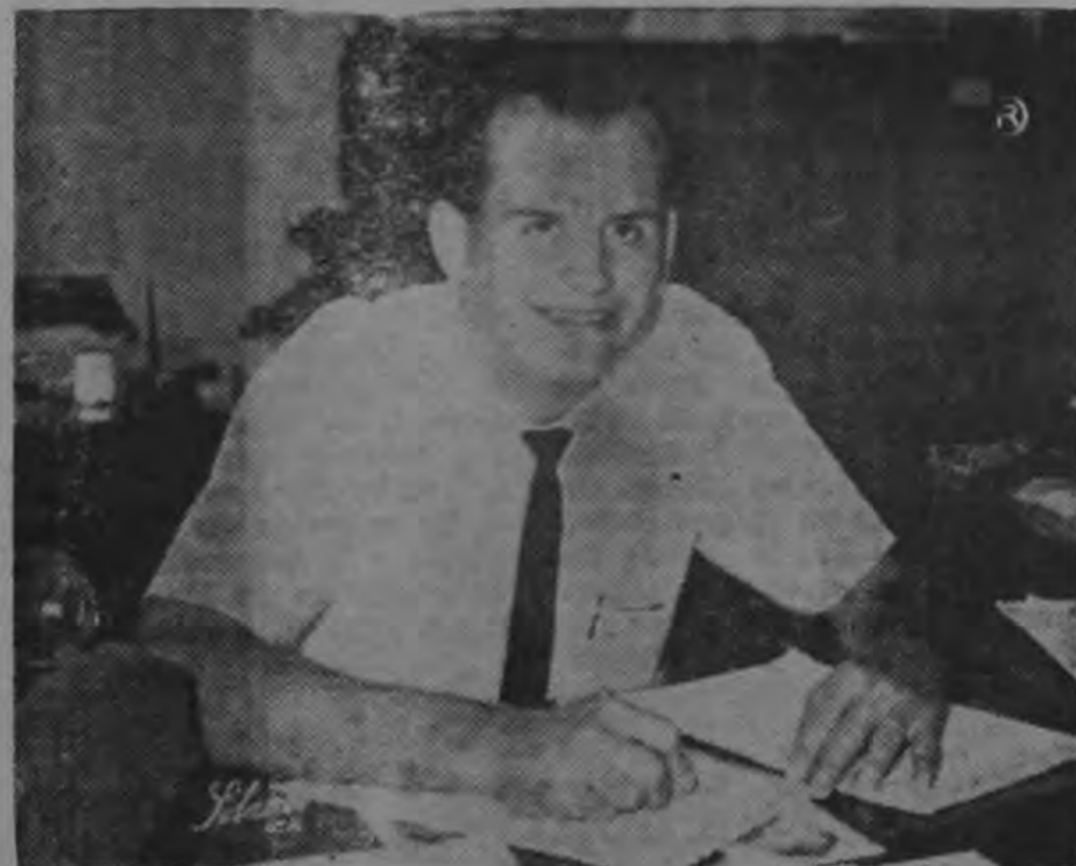
— Flaco Pérez suspendido por una fecha —

— También nombró árbitros para próximas fechas —