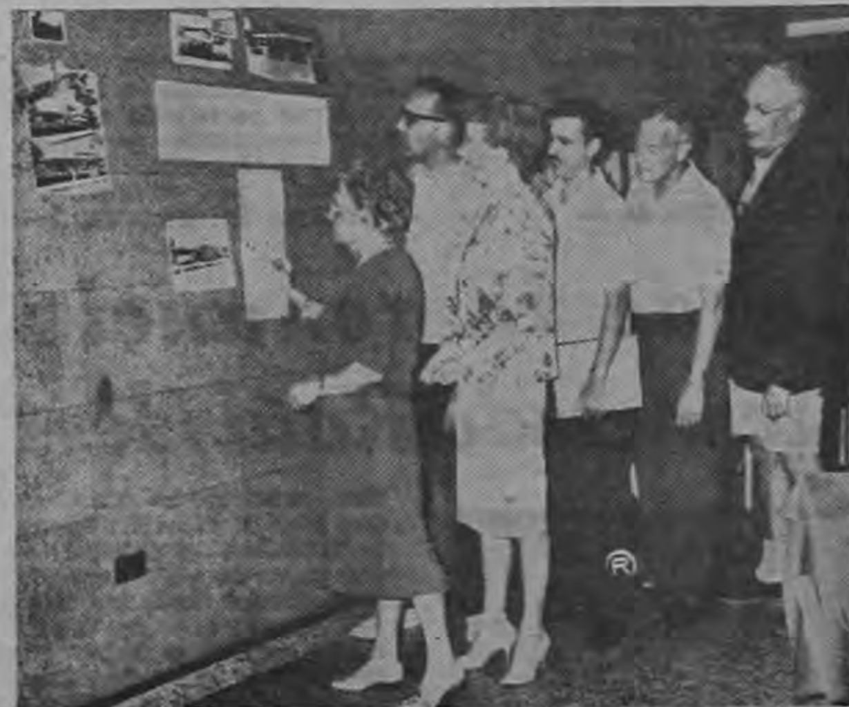
Representantes de las diferentes organizaciones afiliadas al National Institute o Diaper Services durante convención realizada en San Juan, Puerto Rico, el mes pasado, leen la lista de los hospitales de Costa Rica para escoger aquél al que brindarán su ayuda. Las fotografías que se ven en la pared, corresponden a instituciones hospitalarias nacionales.

Myrdal se expresó con igual franqueza en sus comentarios acerca de la corrupción y el feudalismo todavía existentes en numerosos países subdesarrollados.