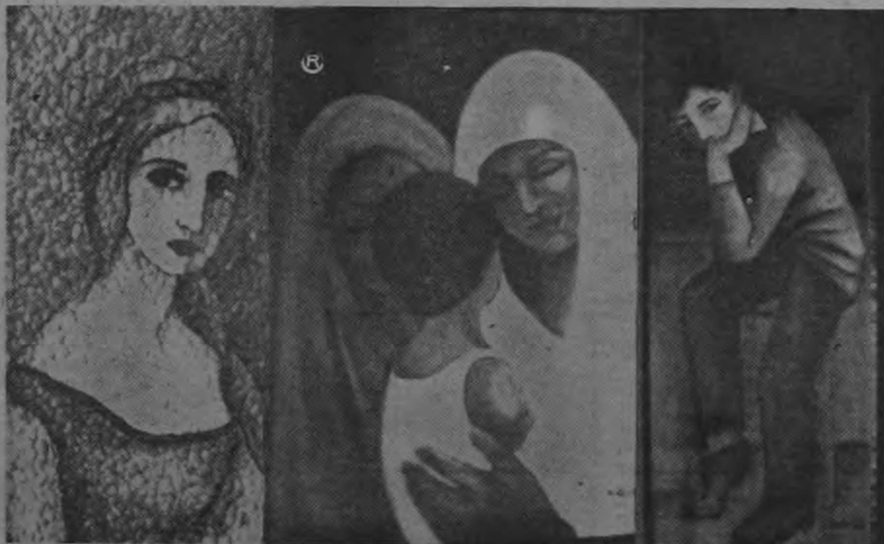
EXPOSICION de pinturas en el Centro Cultural Costarricense promovida por los alumnos del IV año de Bellas Artes de la Universidad Na-

El Ministerio de Trabajo y Bienestar Social envió proyecto de reforma del artículo 308 del código de la materia para que las exenciones de impuestos y recargos de Aduana alcancen también a simientes y animales de cría que importen estos organismos. — (TEXTO EN PAGINA 8) —